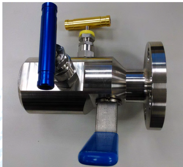
圖 1. 3 合 1 整合式閥體

將傳統多個單功能閥整合於一多功能閥體，下圖為 3 合 1 多功能閥體，期中包含 2 個針閥與 1 個球閥功能。與單功能 3 閥體串接比較功能相同，但是整合式閥體洩漏點下降至少 30%、材料與包材節省 50% 以上、整體高度下降 50% 以上。